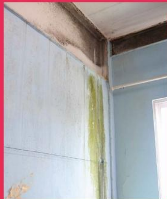
E.M. Prefeito Samir Macedo Nascir - Vila Isabel