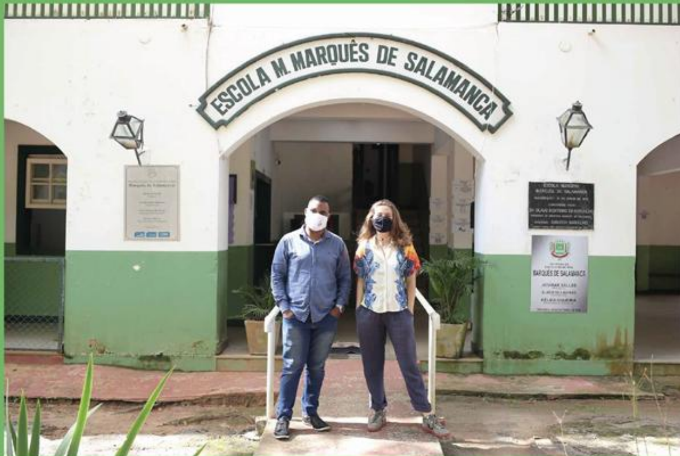
E.M. Marquês de Salamanca - Bemposta

Diretores que durante as aulas remotas iam pessoalmente à casa dos alunos a fim de verificar as condições de aprendizado.