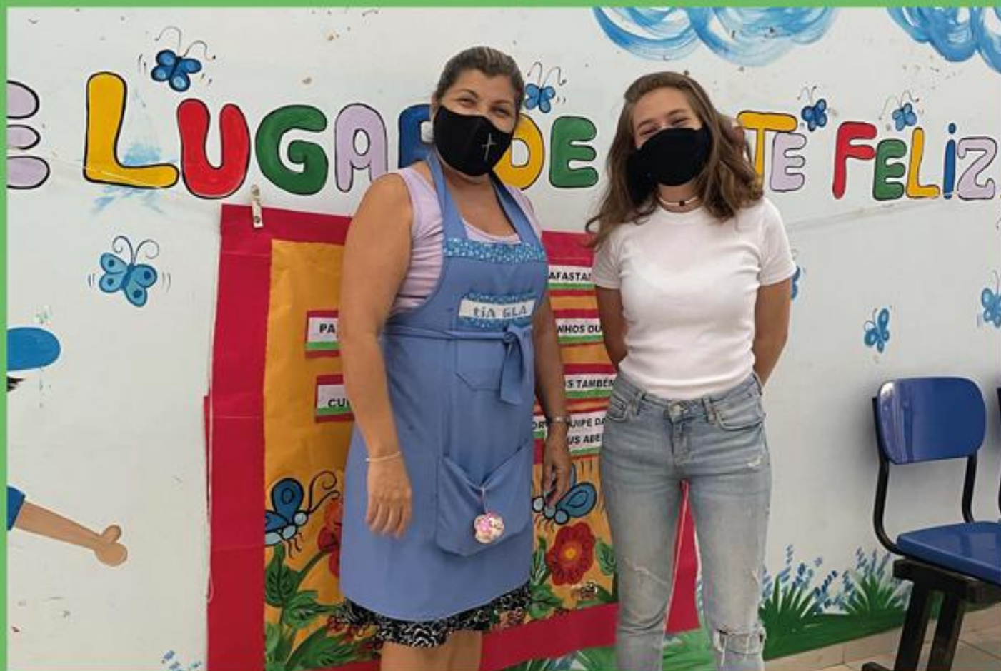
Creche José Ferreira de Cerqueira – Habitat

Profissionais que, apesar dos obstáculos enfrentados, seguem investindo na vida dos alunos e nas escolas, algumas vezes com verbas próprias.