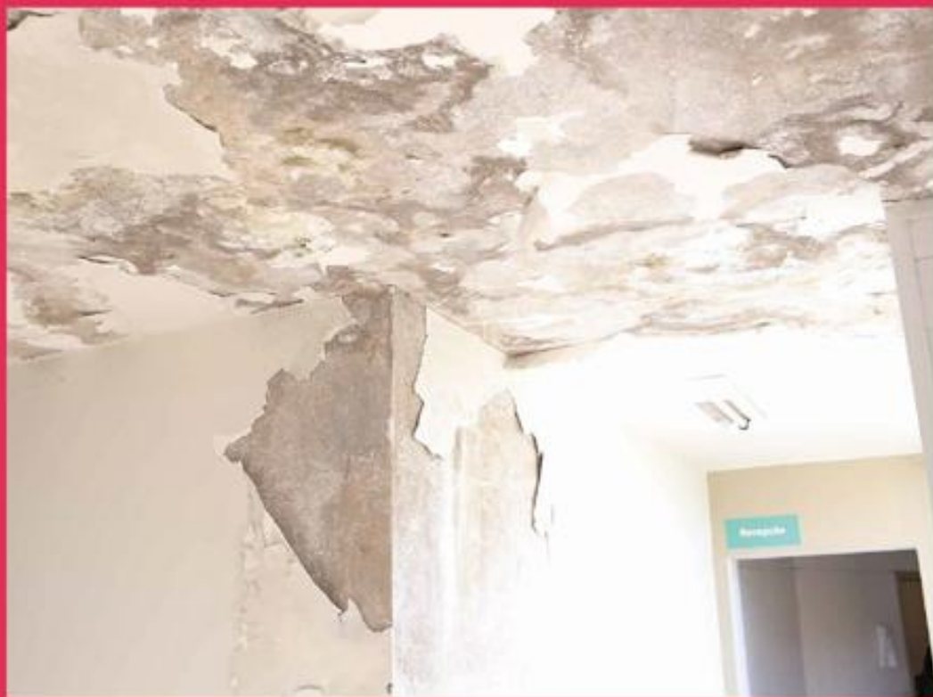
Planeta Criança - Centro

Instituições com constantes infiltrações e goteiras.