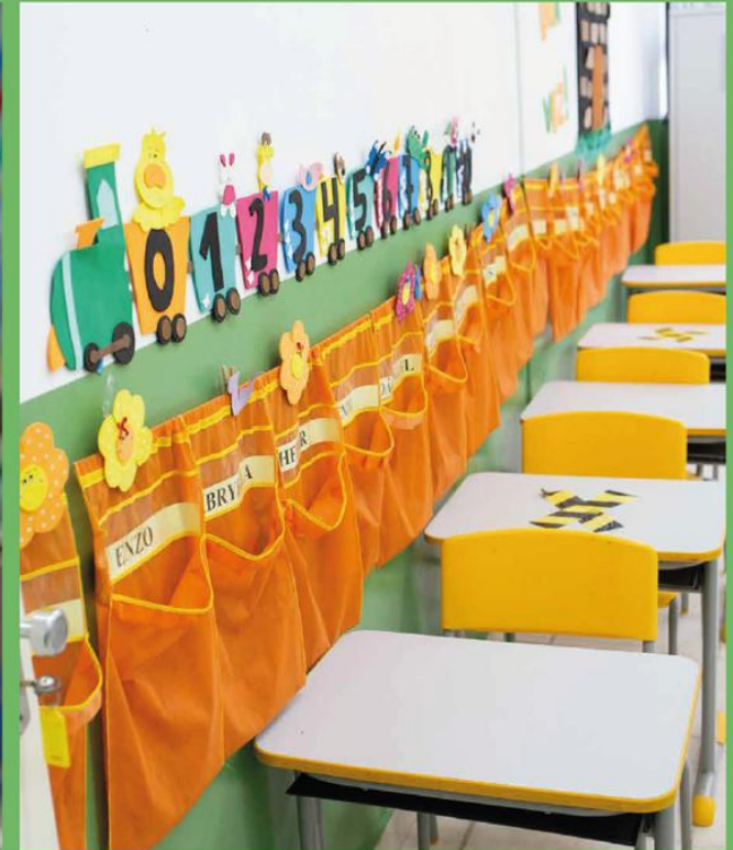
E.M. Nossa Senhora Aparecida – Ponto Azul