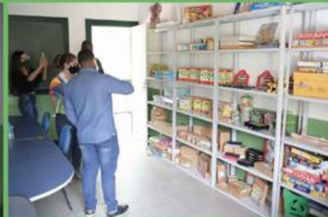
E.M. Marquês de Salamanca - Bemposta