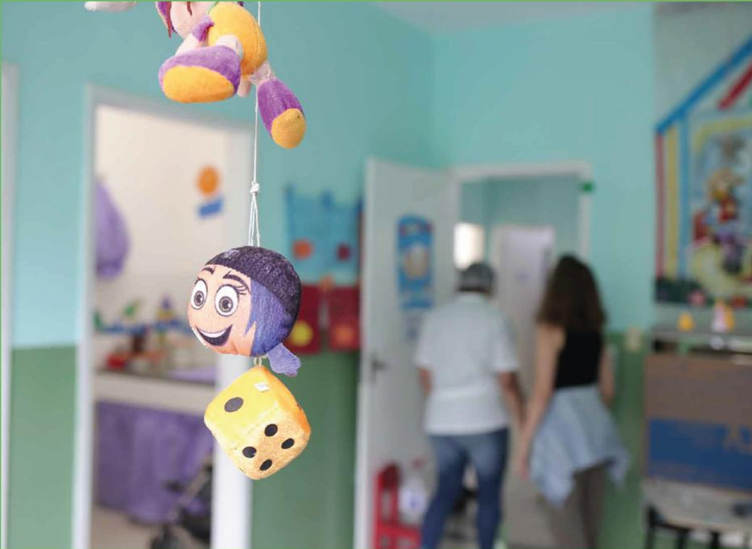
Creche Municipal Alencar Jacob - Cariri

Escolas e creches com estruturas de ponta.