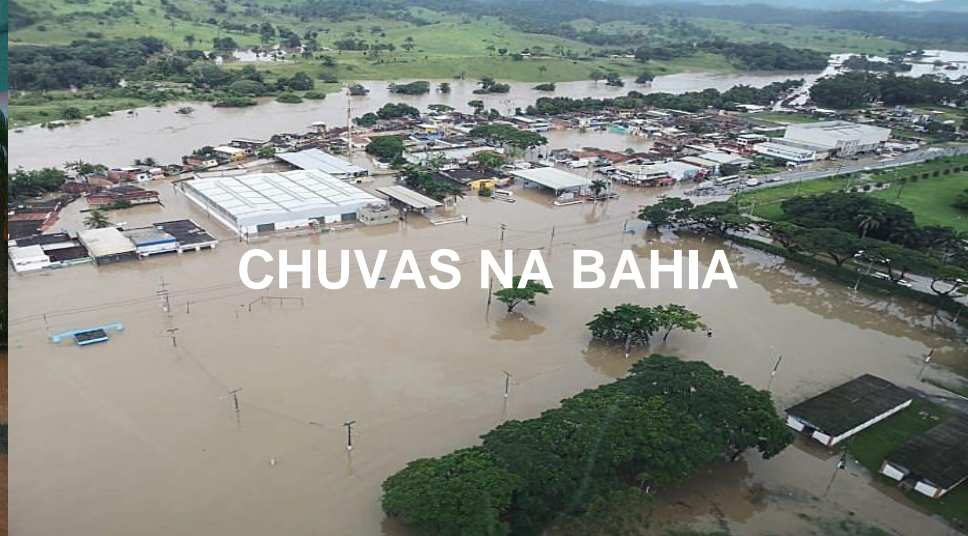
CHUVAS NA BAHIA