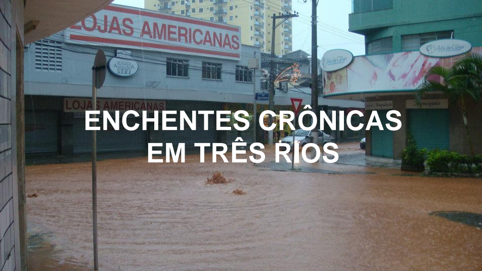
ENCHENTES CRÔNICAS EM TRÊS RÍOS