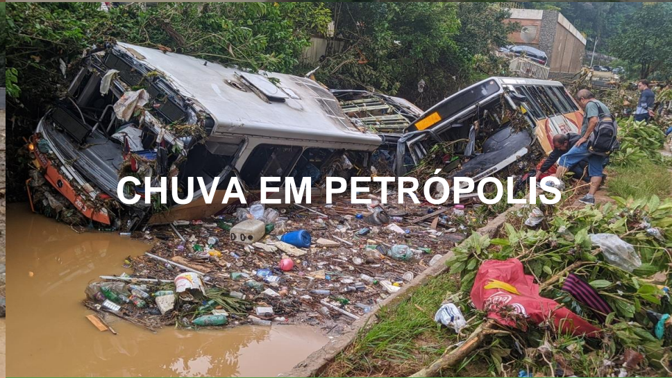
CHUVA EM PETRÓPOLIS