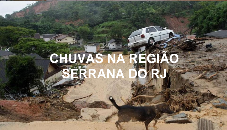
CHUVAS NA REGIÃO SERRANA DO RJ